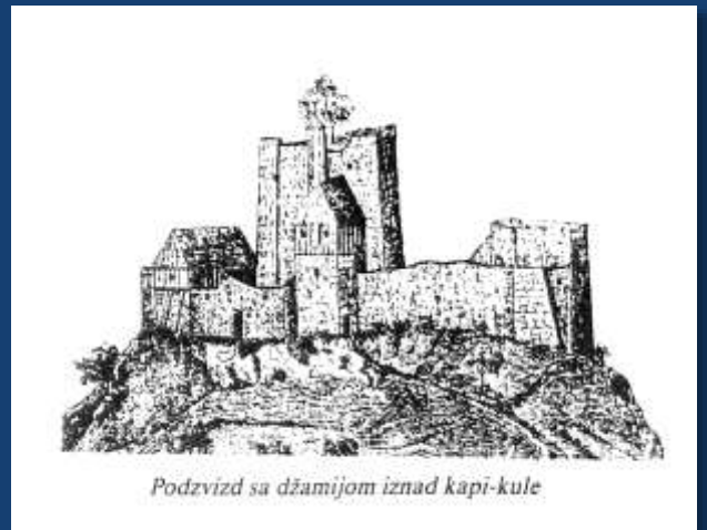
Podvizd sa džamijom iznad kapi-kule